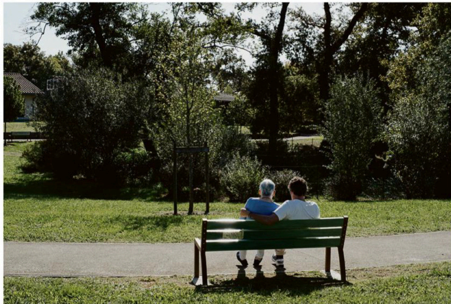
Une résidente du village Henri-Emmanuel et son fils, mercredi à Dax.

À Dax, le projet expérimental inspiré d'un modèle néerlandais se veut un havre de liberté et de médicalisation douce, à rebours des institutions restrictives, pour permettre à ses 120 résidents de mener une vie aussi normale que possible malgré la maladie.